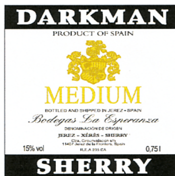
DARKMAN MEDIUM SHERRY