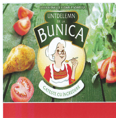
UNTDELEMN DE LA BUNICA GATESTE CU ÎNCREDERE

(591) Culori revendicate:verde, alb, galben, bej, roșu, auriu, portocaliu, gri, maro