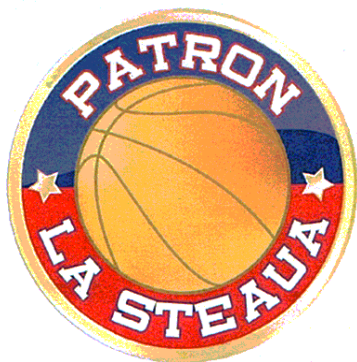
PATRON LA STEUA

(591) Culori revendicate:auriu, roșu, albastru, portocaliu, negru, alb