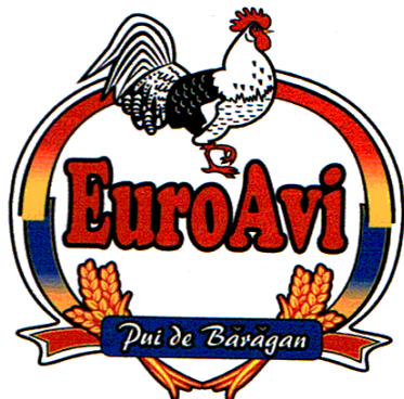
EuroAvi Pui de Bărăgan

(591) Culori revendicate:alb, negru, galben, roșu (pantone 485C), albastru (pantone Reflex Blue) (531) Clasificare Viena: 030703; 050702; 240723; 270502; 270503; 270515; 290115; (511) Produse și/sau servicii grupate pe clase: 29 Carne depășare. 35 Regruparea în avantajul terților a produselor din clasa 29 (cu excepția transportului lor) permițând consumatorilor să le vadă și să le cumpere comod.