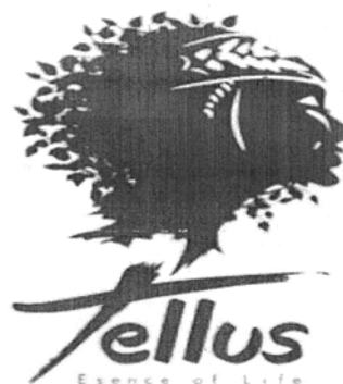
tellus Esence of Life

(531) Clasificare Viena :020301; 270501;