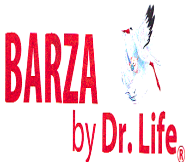
BARZA by Dr. Life

(591) Culori revendicate:roșu, albastru, alb, roz, negru