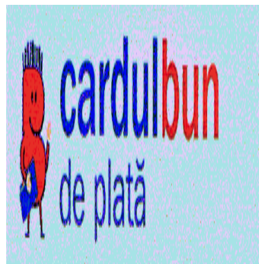
cardul bun de plată

(591) Culori revendicate:bleu (pantone 290C), albastru (pantone 294C), roșu, albastru (pantone 539 C), bej (pantone 169 C)