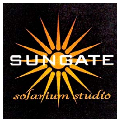
SUNGATE solarium studio

(591) Culori revendicate:negru, portocaliu, alb