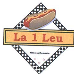
La 1 Leu Made in Romania

(591) Culori revendicate:galben, roșu, brun