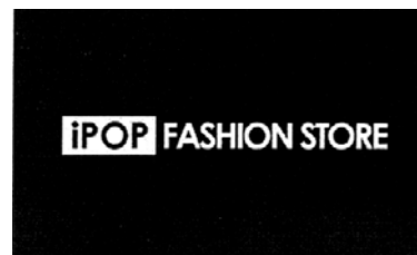
iPOP FASHION STORE