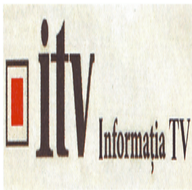
itv Informația TV

(591) Culori revendicate: negru, roșu, alb