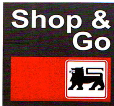
Shop & Go