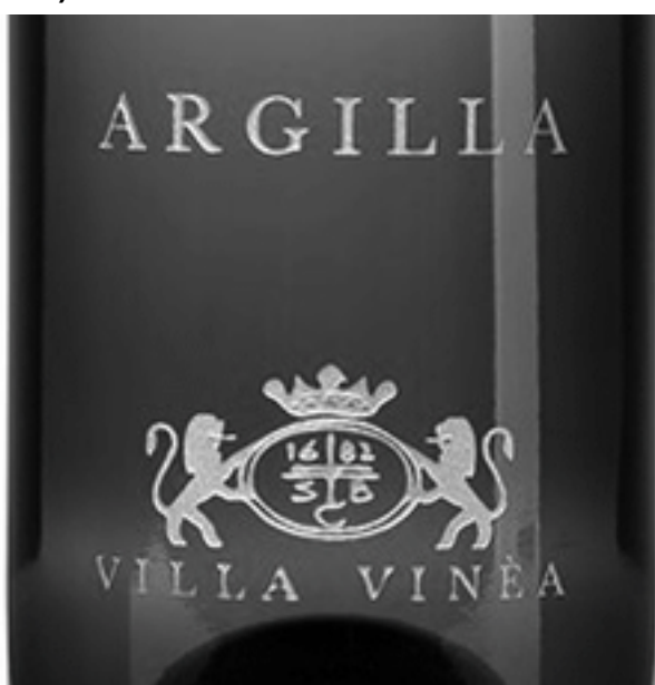
ARGILLA 1682 SCB VILLA VINEA

(531) Clasificare Viena: 20.05.15; 03.01.02; 24.09.05; 26.01.17; 27.05.01 (511) Produse și/sau servicii grupate pe clase: 33. Vinuri.